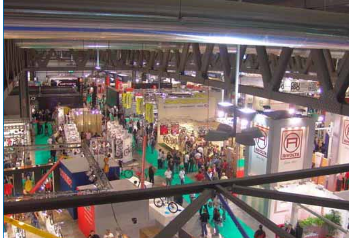
EICMA 2005, 63ª esposizione internazionale del ciclo