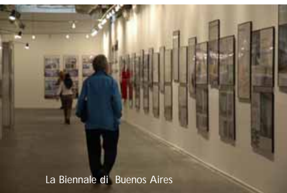
La Biennale di Buenos Aires

Fondazione Fiera Milano ha partecipato dal 21 al 25 settembre scorso alla X Biennale di Architettura di Buenos Aires, dove è stata chiamata a rappresentare l'Italia e ad illustrare la trasformazione del sistema espositivo milanese, anche grazie a sei installazioni multimediali. La Biennale di Buenos Aires, considerata con quelle di Venezia e San Paolo una delle più importanti al mondo, rappresenta un palcoscenico importante per esporre anche oltre oceano le idee e i progetti che stanno rinnovando Milano e la nostra regione. Il presidente di Fondazione Fiera Milano Luigi Roth e l'amministratore delegato di Sviluppo