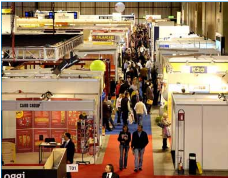
Expo Trade, salone internazionale del Sistema Commercio

I progetti di formazione dell'Accademia di Management Fieristico