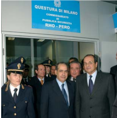
Da sinistra: l'allora Ministro degli Interni Pisanu e il questore di Milano Pessina all'inaugurazione del Commissariato di Pubblica Sicurezza al Nuovo Polo.

Abitate nel Rhodense e volete trasformare la vostra casa in un accogliente bed & breakfast? Per ricevere suggerimenti e informazioni utili potete rivolgervi allo sportello B&B, l'apposito servizio creato dall'amministrazione comunale presso il CentRho di Piazza San Vittore (tel. 02 93332223). Lo sportello, attivo tutti i giovedì, mira ad offrire un supporto concreto agli aspiranti albergatori, desiderosi di trarre vantaggio dalle numerose opportunità offerte dal Nuovo Polo. Gli interessati potranno trovarvi ogni tipo di informazione: dalle più tecniche, come quelle riguardanti le leggi e le procedure che disciplinano l'attività, sino ai consigli sull'arredamento delle stanze, le tariffe da applicare e le possibilità di promozione e comunicazione.