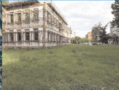
Rifunionalizzazione del centro amministrativo di Cinisello Balsamo: una nuova sede municipale decentrata dove riunire i diversi uffici del Comune ora sparsi in sedi separate.