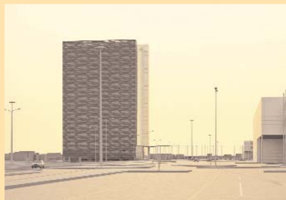
Borio Mangiarotti Srl - CILE Spa Architetti Antonio Citterio e Anna Giorgi