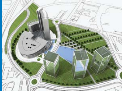
World Jewellery Center: un centro dedicato alla gioielleria voluto dall'Associazione Orafa Lombarda nella zona ovest di Milano.