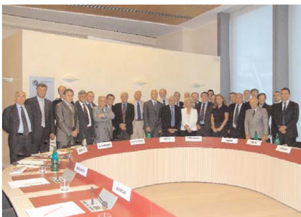
10 luglio 2006: il presidente della Regione Roberto Formigoni insieme ai componenti del nuovo Consiglio Generale di Fondazione Fiera Milano; in basso, la prima riunione.