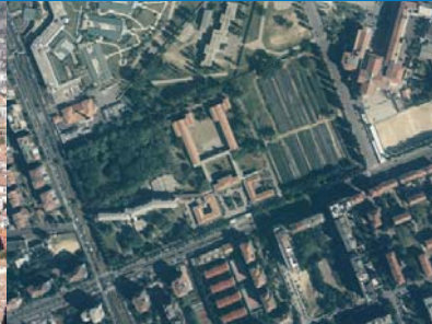
Palazzo dell'Innovazione: sorge in zona Giambellino a Milano un luogo di incontro e di servizio per le imprese milanesi e lombarde, voluto dalla Camera di Commercio di Milano.