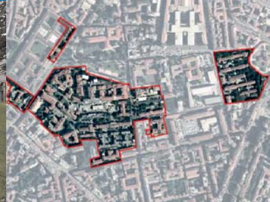
Fondazione IRCCS - Policlinico di Milano: creazione di una "Città della salute" di elevata qualità architettonica e urbana, funzionale alle esigenze del cittadino utente e di chi lavora nella struttura sanitaria.