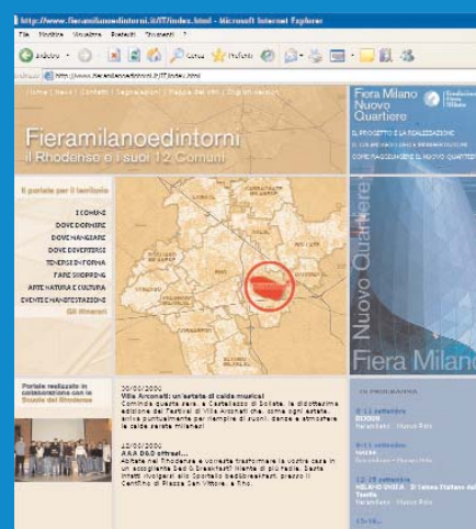
Un esempio di pagina del portale: l'inserimento dei dati è gratuito

Sono stati premiati lo scorso 11 aprile presso il Centro Congressi del Nuovo Polo i vincitori del concorso "www.fieramilanoedintorni.it, tempo libero e servizi a portata di mano", indetto da Fondazione Fiera Milano in collaborazione con le amministrazioni locali, che ha coinvolto oltre 250 studenti del triennio degli istituti superiori dei 12 comuni del Rhodense. 15 i premi in palio: uno per ciascuna delle otto sezioni principali del sito, tre per i migliori itinerari del Rhodense, tre assegnati secondo i criteri di abilità tecnologica, impegno e creatività e uno, il più importante, per la completezza del sito. Ad assegnare i riconoscimenti una giuria composta da rappresentanti del mondo della cultura, dello spettacolo e delle istituzioni: Allan Bay, scrittore e critico enogastronomico, Pia Benci, direttore centrale Turismo e Cultura della Provincia di Milano, dj Alvin, di radio 105,