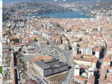
Area Ticosa di Como: il progetto di trasformazione dell'area Ticosa, di proprietà del Comune di Como, coinvolge una zona strategica e di oltre 40.000 metri quadrati.