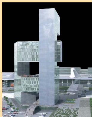
- Codelfa Spa- Grassetto Lavori Spa Architetti BRT (Germania), studio Altieri, e Luca Rossi