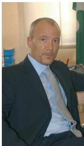
Corrado Peraboni, direttore generale di Fondazione Fiera Milano.